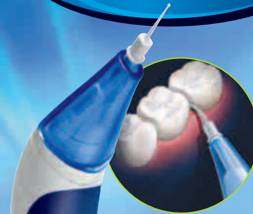
Waterpik® Interdentalreiniger Flosser FLW-220 E