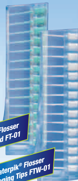
Waterpik® Flosser Tips Standard FT-01